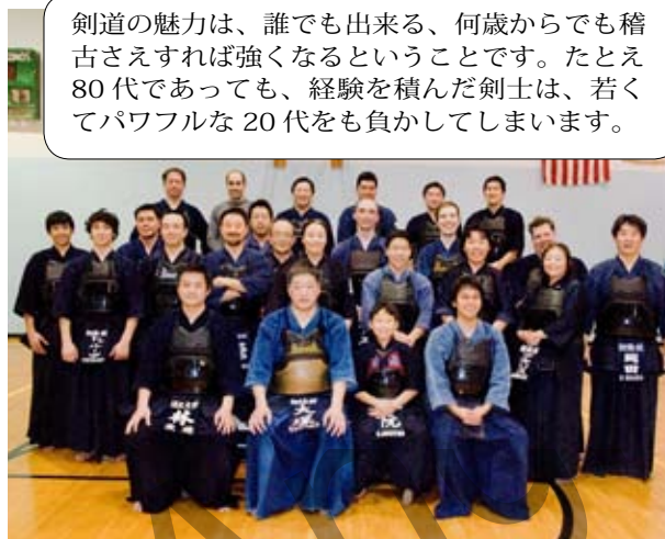
教えてくれたのはこの先生→

剣道の魅力は、誰でも出来る、何歳からでも稽古さえすれば強くなるということです。たとえ80代であっても、経験を積んだ剣士は、若くてパワフルな20代をも負かしてしまいます。