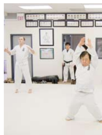
ジャンピングジャック 200回!