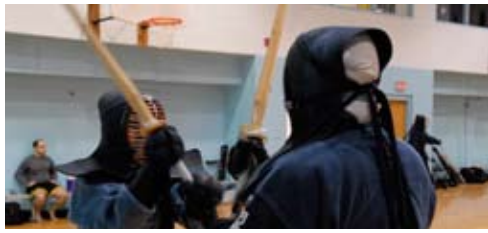
相手の目を見る、それと同時に相手の心の目も探る。

明治末期から大正初期にかけて日本古来の剣術を趣味や健康法として誰にでもたしなめるものとしてスポーツ化したもの。従来の剣術が「斬る」ものであったのに対し、剣道では指定部位のみへの「打突」とその性格は大きく異なっている。道着、袴の上に面、胴、籠手、垂れなどの防具を着用し、竹刀により面(頭頂部)、突き(のど)、小手(右手)、胴(腹部)の所定部位を攻撃する。これらの所定部位に竹刀を当てると有効打となり、一本とされる。試合は三本勝負が基本であり、所定時間内に先に有効打二本を先取した方が勝ちとなる。剣道では剣術の殺人術としての危険な側面は廃し、「大和魂」という日本人としての誇りや厳しい修行による人間形成という「活人」の精神を継承し、精神修養の手段として学校の体育教育、部活動をはじめとして老若男女を問わず広く親しまれている。(http://e-words.jp スポーツ辞典より)